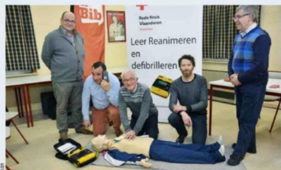
De eerste activiteit wordt een cursus reanimatie met het Rode Kruis.

Zo is er op 21 februari in de LINK een infoavond over reanimatie. Daarvoor werkt de bib samen met het Rode Kruis (afdeling Ledegem, Moorslede en