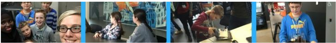
Zapper-activiteit Helpen in ARhus

Ouders en kinderen vinden eveneens hun gading in ARhus: we doen mee met de Jeugdboekenmaand, Voorleesweek, KJV, Jeugdfilms in de vakantie, de Roeselaarse Zapper-activiteiten, de Techniekacademie, vormingsavonden van het Infopunt Opvoeding, ... In 2016 startte de reeks Kennismakers Junior over bijzondere beroepen.